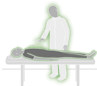
Abb. 1: Subtle Body Balance: Der Feinstoffkörper des Therapeuten sendet ein Signal, das den Feinstoffkörper des Patienten aktiviert.

Wie sowas denn bitte funktionieren sollte, werde ich oft gefragt. In den Gesprächen werden dann meist unser überlastetes Gesundheitssystem und die immer schlechter werdenden Arbeitsbedingungen in Praxen und Kliniken zum Thema. Die Entwicklung ist ohne Frage besorgniserregend. Gerade deswegen ist es so wichtig für den Einzelnen, sich zu fragen, wie es für ihn jenseits aller „Schutzmaßnahmen“ einen Weg zu einem erfüllteren, kraftvolleren Arbeiten geben kann.